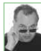
Autor: Dr. Josef Fally, Mitarbeiter des Naturschutzbundes Burgenland