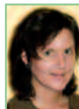
Autorin und Fotos: Mag. Elke Schmelzer, freie Mitarbeiterin des Naturschutzbundes Burgenland

Anfang Ährenmaushügel: Im August beginnen die Ährenmäuse damit Vorräte zusammenzutragen. Beim Begehen der Felder kann man bereits die beginnenden Vorratsspeicher entdecken. Genau wie der Feldhamster profitiert die Ährenmaus davon, wenn die abgeernteten Felder nicht umgebrochen werden.