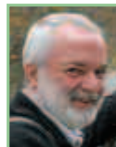
Autor und Foto: Ing. Walter Laschober, Mitarbeiter des Naturschutzbundes Burgenland

Ing. Walter Laschober, E-Mail: walter.laschober@bkf.at Tel: 0664 46 10 103