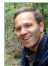
Autor & Fotos: Dr. Georg Wolfram, Geschäftsführer der DWS Hydro- Ökologie GmbH

Das Äschenprojekt entwickelte sich damit in den vergangenen Monaten zu mehr als einem reinen Naturschutzprojekt. Revier-, Gemeinde- und Landesgrenzen spielen heute eine geringere Rolle als das gemeinsame und grenzüberschreitende Bemühen um eine Verbesserung der fischökologischen und fischereilichen Situation an der Lafnitz. Damit wird das Äschenprojekt auch dem eigentlichen Ziel der Gemeinschaftsinitiative LEADER+ gerecht, nämlich der Förderung der Entwicklung des ländlichen Raums und der Vernetzung ländlicher Gebiete.