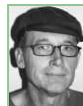
Autor: Dr. Erwin Nemeth Ornithologe am Max Planck Institut für Ornithologie in Seewiesen

*(Starke Rückgänge im Bestand traten vor allem nach trockenen Jahren mit niedrigem Seepiegel auf, die weißen Pfeile zeigen Jahre mit einem extrem niedrigen April-Wasserstand von weniger als 115,40 m über Adria).