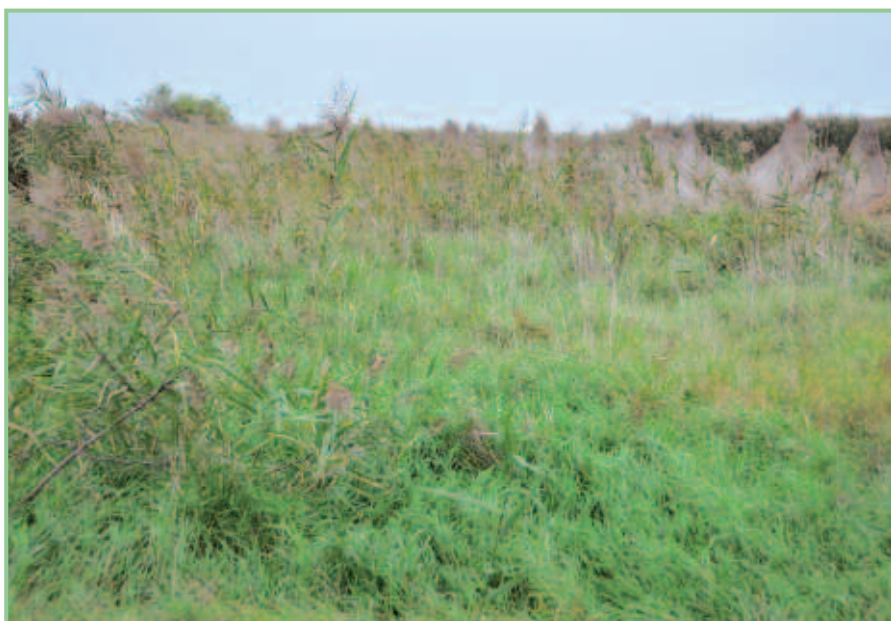
Schilflagerplatz in den Seewiesen