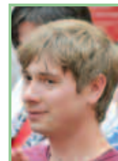
Autor: Stefan Weiss, Mitarbeiter des Naturschutzbundes Burgenland

Bisher wurden im Rahmen des Projektes eine Analyse der vorhandenen Managementpläne, die Erstellung einer Interessensgruppendatenbank, eine Tabellenbewertung der Einflüsse und Risikofaktoren sowie ein Bericht über die Auswirkungen der landwirtschaftlichen Nutzungen auf den See erarbeitet. Begleitend fanden mehrere interne Projekttreffen, zwei Lokalausweise mit Experten im Seevorgelände, mehrere internationale Treffen und Koordinationsgespräche mit dem „Austrian Institute of Technology“ und den burgenländischen Partnern statt.