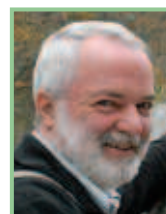
Autor und Fotos: Ing. Walter Laschober Mitarbeiter des Naturschutzbundes Burgenland

Detaillierte Informationen bekommen Sie unter der Telefonnummer 0664/4610103 bzw. per E-Mail: walter.laschober@bkf.at .