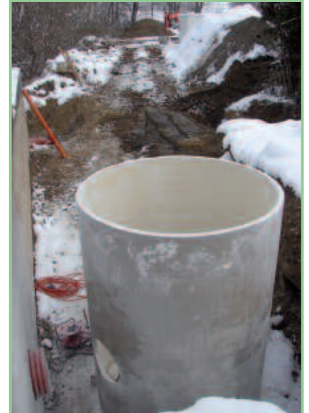
Hier entsteht ein Aufzuchtgerinne für die Lafnitz-Äsche.

Eine Stärkung des Bestandes durch Äschenbesatz aus einer Fisch-