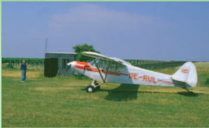
Abb. 2: Der erfahrene Pilot (Robert Klein) und das Flugzeug (Piper P-18), das für die Reiherzählungen verwendet wird.