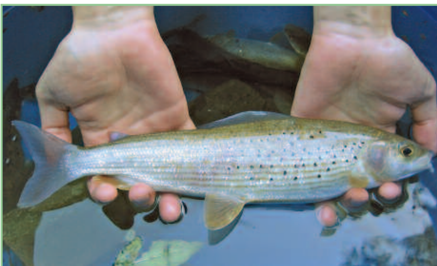
Thymallus thymallus - Leitart der Äschenregion.

In der Bauphase I ist die Errichtung eines Verteilersystems, von