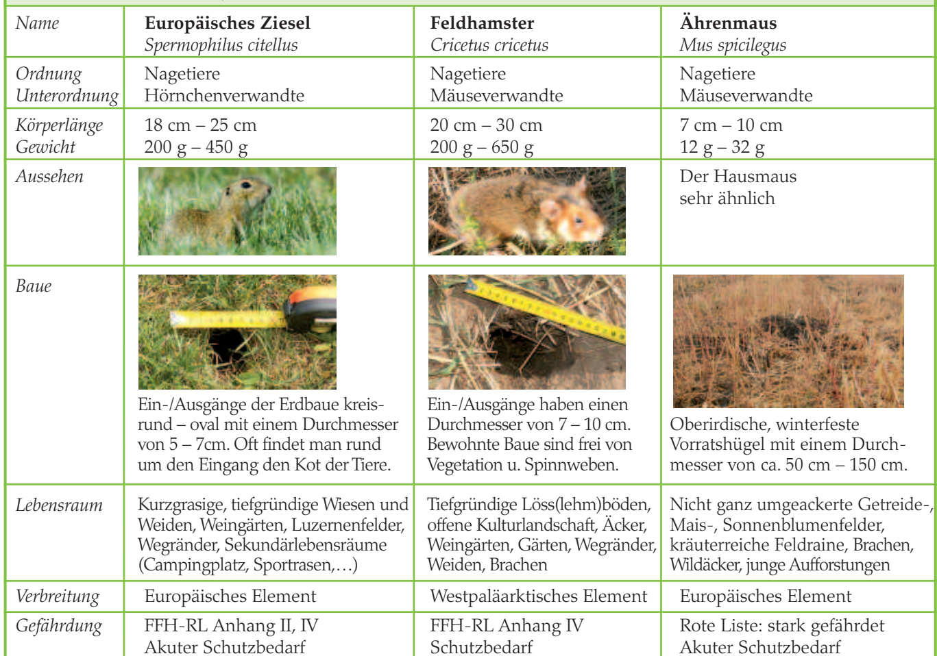
Übersichtstabelle: Ziesel, Feldhamster und Ährenmaus