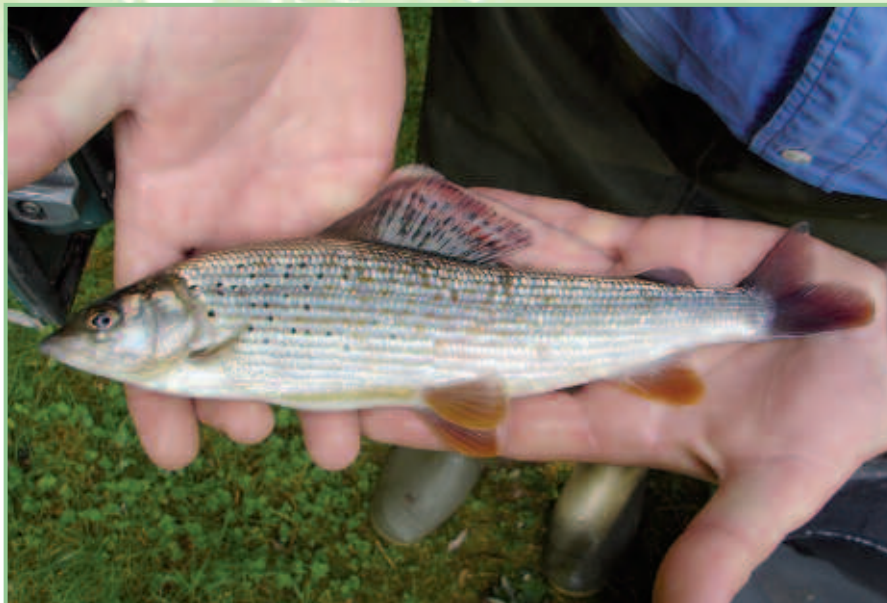
Charakteristisches Merkmal der Äsche ist die große Rückenflosse, die auch als „Fahne“ bezeichnet wird.

Filterbecken und des Gerinnes selbst geplant. In einer künftigen Bauphase II soll ein Bruthaus eingerichtet werden, das nach dem Abstreifen auch das Erbrüten der Eier bis zu einer Größe erlaubt, ab der sie in das Gerinne umgesetzt werden können. Im vergangenen Jahr konnten die naturschutz- und die wasserrechtliche Bewilligung eingeholt werden. Der Bau des Aufzuchtgerinnes ist mittlerweile in vollem Gange, der Abschluss der Bauphase I für März/April 2011 geplant.