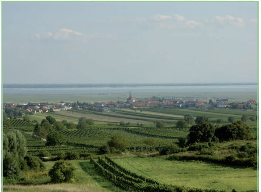
Vielfältige Kulturlandschaft am Beispiel von Jois

Zwischen 1976 und 2010 stiegen die Temperaturen in der Neusiedlerseeregion um 0,5° C pro Dekade an. Aufgrund der erhöhten Lufttemperatur stieg auch die Wassertemperatur des Neusiedlersees signifikant an. Die mittleren saisonalen Temperaturen am Neusiedler See lagen in der Peri-