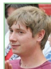
Autor und Fotos: DI Stefan Weiss, Mitarbeiter des Naturschutzbundes Burgenland

Eine Zusammenfassung der Ziele, Gefahren und Maßnahmen für den Neusiedlersee erfolgt in einer anwendungsorientierten Leitlinie für regionale Entscheidungsträger und Interessensgruppen. Diese soll informieren und Möglichkeiten aufzeigen, wie in konkreten Situationen gehandelt werden kann. Eine Präsentation der Ergebnisse und der Leitlinie findet in einer Abschlussveranstaltung im September 2013 statt.