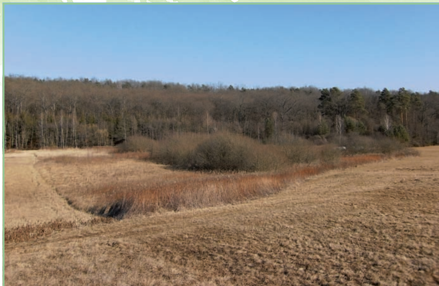
Punitz - Haselbach