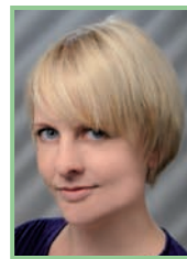
Autorin: Mag. Christina Zwickl, Esterhazy Betriebe GesmbH

Auch hier muss darauf geachtet werden, das Leben und die Arbeiten im Wald gemäß den Verhaltensregeln nicht zu stören. Für ein verständnisvolles Miteinander sollten Pilze ausschließlich in der Zeit zwischen 8 und 16 Uhr gesammelt werden.