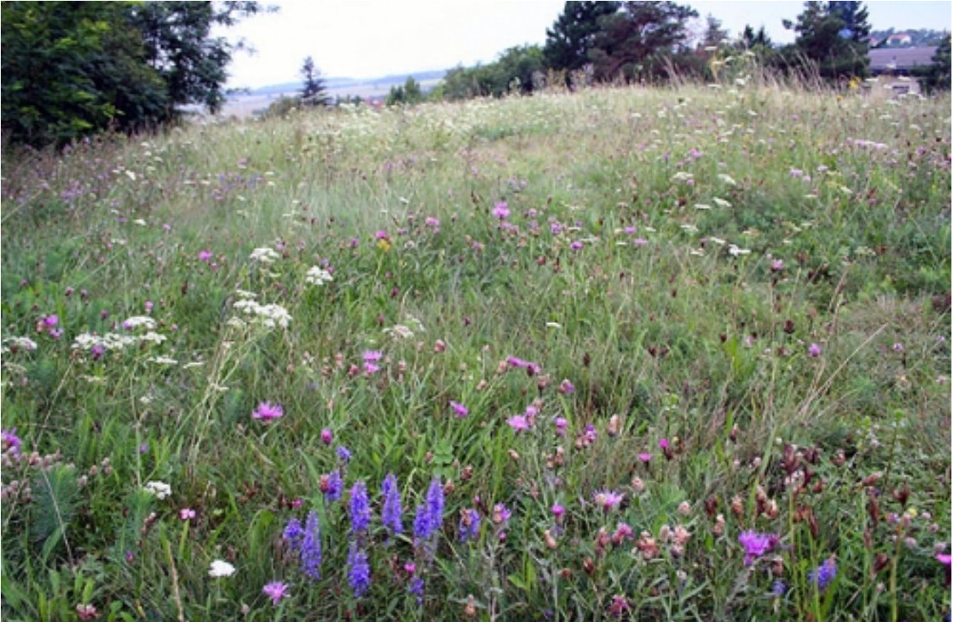
Die Meidung des Gestrüchs mit Strohauflage und dem Einsatz von Pflanzenschnittgut der Böden,